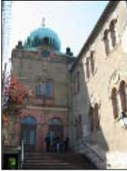
Synagogue de Bouxwiller

c) Des inventaires comme prétexte à des activités plastiques